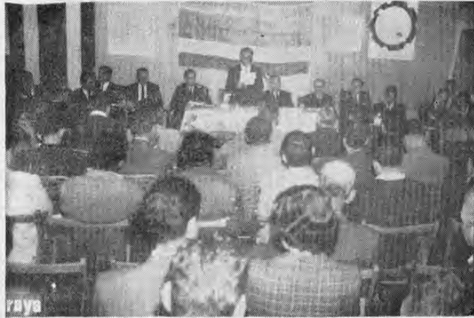
En los altos del Mercado Central se verificó anoche la Asamblea General de la Asociación Nacional de Medianos y Pequeños Industriales. Asistió a ella el Ministro de Industrias y Comercio.